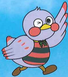
埼玉県のマスコット 「さいたまっち」