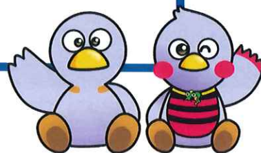
「コバトン」「さいたまっち」

第68回精神保健福祉全国大会事務局 (埼玉県疾病対策課精神保健担当) TEL: 048-830-3565 E-mail: a3590-13@pref.saitama.lg.jp