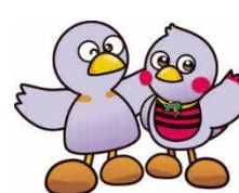
埼玉県マスコット 「コバトン」「さいたまっち」