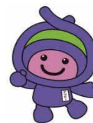
上尾市マスコット 「アッピー」