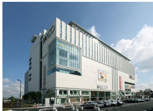
(浦和パルコ外観:浦和コミュニティセンター9階)